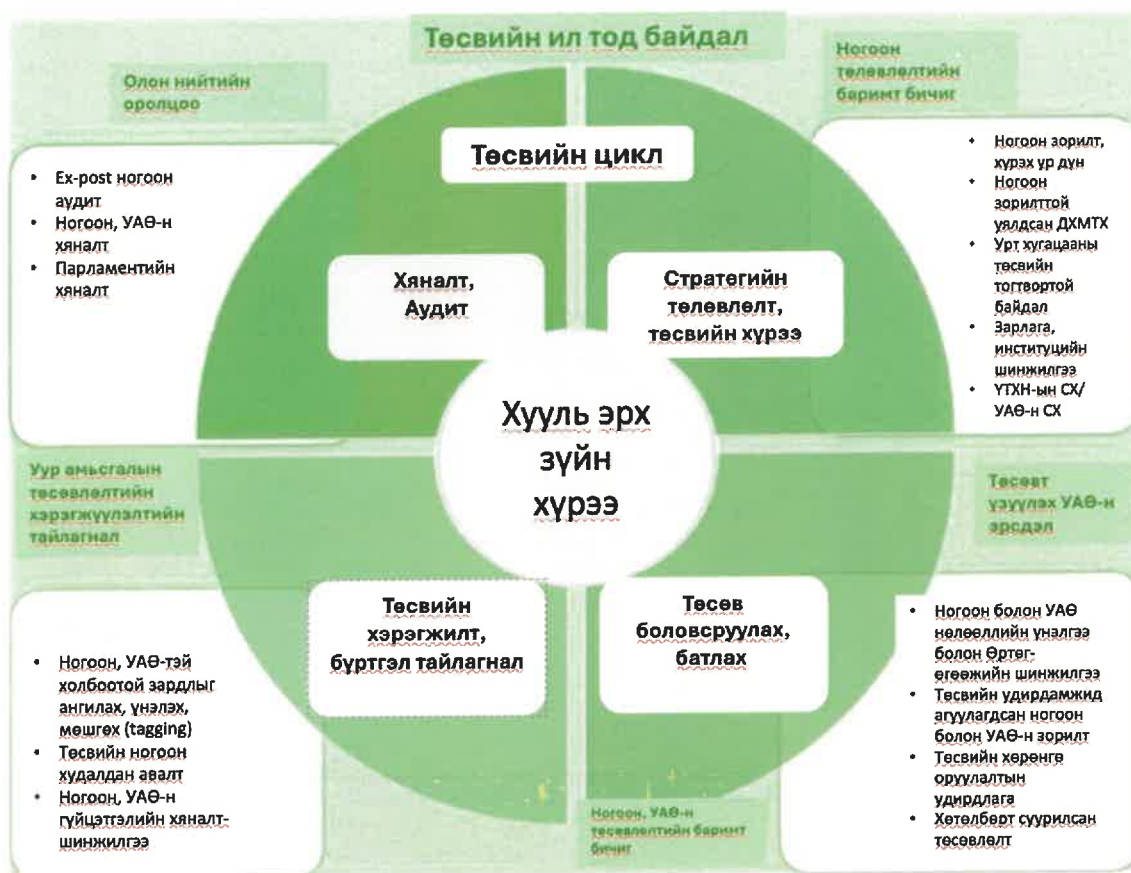
Зураг 1. Ногоон зорилтыг Төсөв, санхүүгийн тогтолцоонд нэгтгэх цар хүрээ