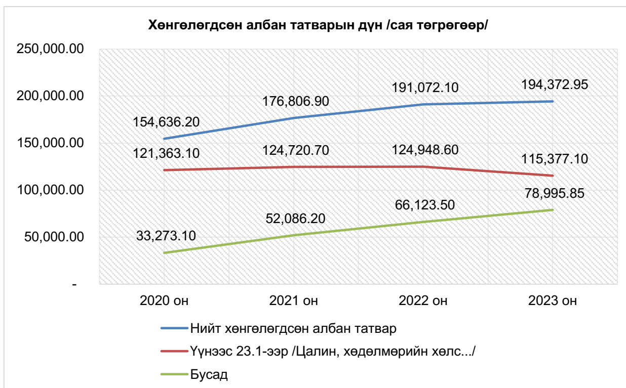
График 6. Хөнгөлөгдсөн албан татварын дүн, сая төгрөгөөр (2020-2023 он)

2020-2023 онд нийт хөнгөлөгдсөн албан татварын хэмжээ жил бүр өссөн үзүүлэлттэй байна.