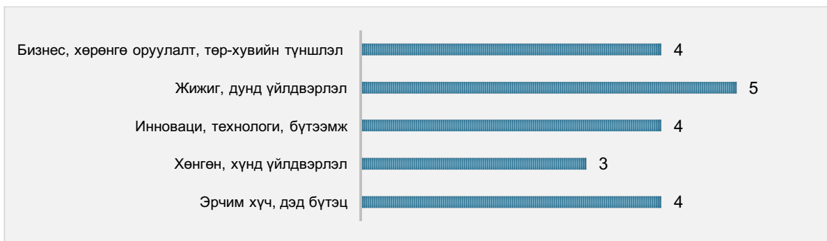
Зураг 2. Байнгын хороодын эрхлэх асуудлын уялдаа

Эрх зүйн зохицуулалтын хувьд, судалгаанд авагдсан улс орнуудаас Норвег, Өмнөд Солонгос, Португал, Финланд, Шинэ Зеланд, Швед зэрэг улсын парламентын тухай хууль болон дэгийн тухай хуульд тодорхой тусгагдсан байна.