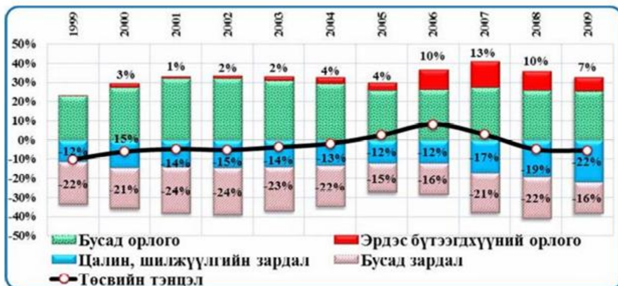
Зураг 2. Төсвийн орлого, зардлын бүтэц, ДНБ-д эзлэх хувиар

2006-2008 онуудад эрдэс бүтээгдэхүүний үнийн өндөр өсөлт, түүхий эдийн үнийн гэнэтийн өсөлтийн татвар зэргээс шалтгаалан төсвийн эрдэс бүтээгдэхүүний орлого их байсан бөгөөд орлогын өсөлтийг дагаад төсвийн зардал ч мөн өсч байсан.