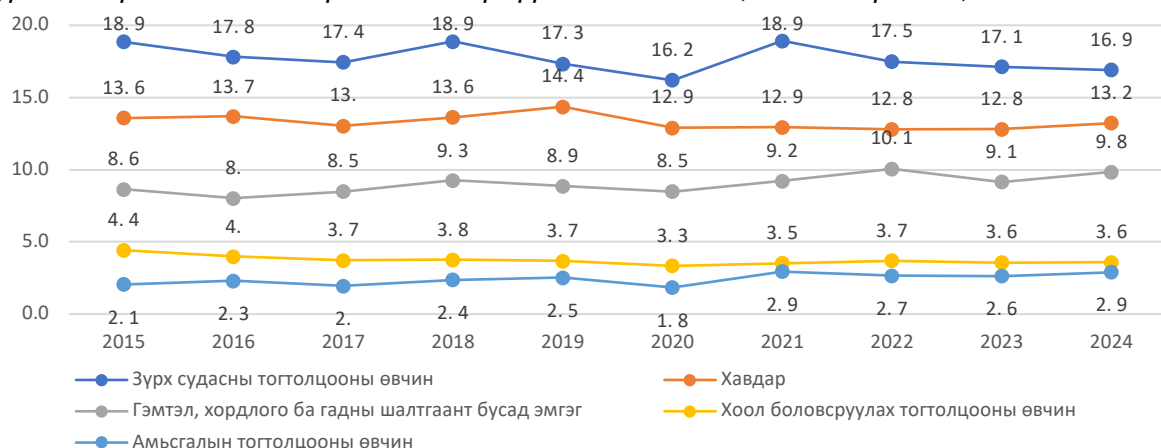
Зураг 2. Хүн амын нас баралтын тэргүүлэх шалтгаан, 10 000 хүн амд, 2015-2024 он.

Тогтвортой хөгжлийн зорилтын хэрэгжилтийг хэмжих нэг гол үзүүлэлт нь 30-70 насны хүн амын дунд зүрх судасны өвчин, хавдар, чихрийн шижин, амьсгалын замын архаг өвчний шалтгаант нас баралтын тоо үзүүлэлт юм. Монгол Улсын хувьд 2024 онд тухайн насны нас баралтын 6405 тохиолдол бүртгэгдэж, нийт нас баралтын 35.4 хувь буюу дэлхийн дунджаас хоёр дахин өндөр байгаа нь эдгээр өвчний эмчилгээний оновчтой, үр дүнтэй байдалд онцгойлон анхаарал хандуулах зайлшгүй шаардлагатай байгааг харуулж байна.