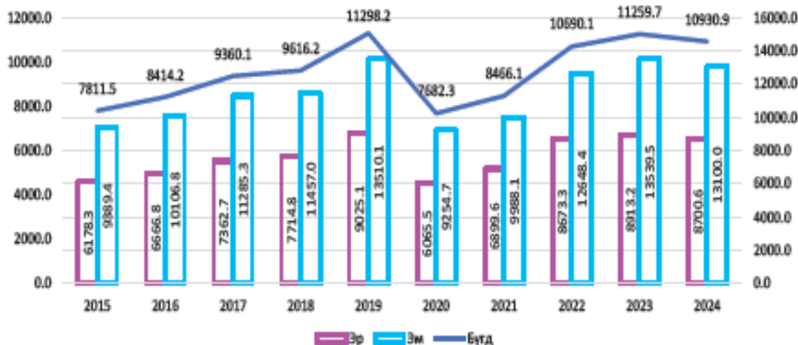
Зураг 1. Хүн амын өвчлөлийн тэргүүлэх шалтгаан, 10,000 хүн 2015-2024 он.

Мөн хүн амын нас баралт 2024 онд 18.1 мянга болж, сүүлийн 10 жилийн дунджаас 875 хүн (4.8%)-ээр нэмэгдсэн бөгөөд нас баралтын 30,1% буюу тэргүүлэх шалтгаан нь зүрх судасны тогтолцооны өвчин 1690 (10000 хүн амд) болон хавдар 1320 (10000 хүн амд) эзэлж байна.