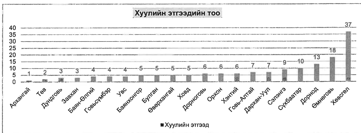
1 дүгээр график

Өмнөговь аймгийн 51 хувийн өмчийн оролцоотой “Таван толгой” ХХК-ийн санхүүгийн тоон үзүүлэлтүүд нэгдсэн дүнд тусгаагүй бөгөөд уг компани нь 2016 онд 177 ажилтантай үйл ажиллагаа явуулж, 181.3 тэрбум төгрөгийн орлого олж, 111.2 тэрбум төгрөгийн зардал гарган 54.04 тэрбум төгрөгийн цэвэр ашигтай ажилласан байна.