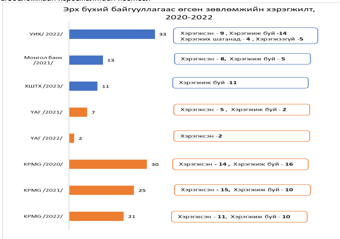
Дүрслэл 3: Зөвлөмжийн хэрэгжилтийн нэгтгэл

2.1 Тус банкны үйл ажиллагаанд 2020-2022 оны байдлаар УИХ, УАГ, Монгол банк, Сангийн яам зэрэг төрийн байгууллага болон хөндлөнгийн аудитын “Кэй Пи Эм Жи Аудит” ХХК зэрэг эрх бүхий байгууллагаас хяналт шалгалт, аудит хийж нийт 154 зөвлөмжийг өгснөөс 64 буюу 41.6 хувь нь биелж, 90 буюу 58.4 хувь нь биелээгүй нь ТУЗ болон дотоод аудитын хорооноос зөвлөмж хэрэгжүүлэх, шийдэл чиглэлийг тухай бүр гаргаагүйтэй холбоотой байна.