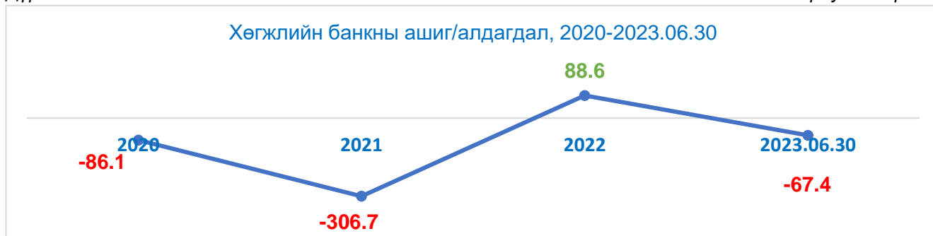
Дүрслэл 2: МУХБ-ны ашиг/алдагдал 2020-2023 тэрбум төгрөг

Эх сурвалж: МУХБ-ны бизнес төлөвлөгөөний хэрэгжилт.