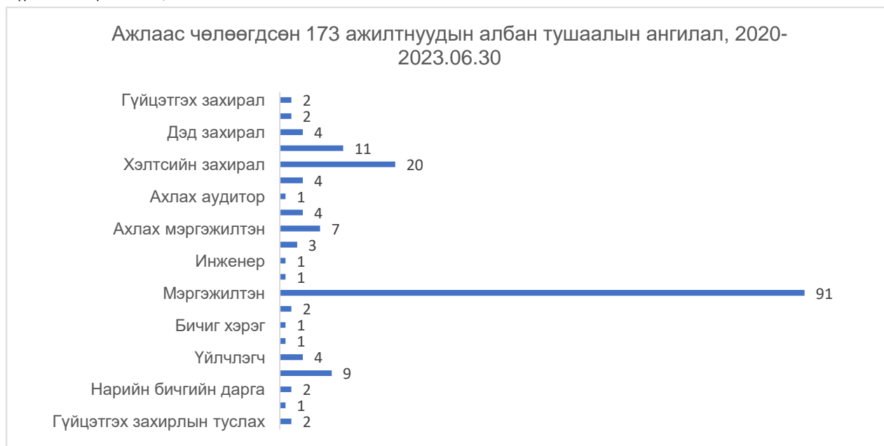
Дүрслэл 1: Хүний нөөцийн хөдөлгөөн

Хөгжлийн банк нь 2020-2021 онд 86.1 тэрбумаас 306.7 тэрбум төгрөгийн алдагдалтай ажиллаж байсан бол 2022 онд 88.6 тэрбум төгрөгийн ашигтай гарсан байна.