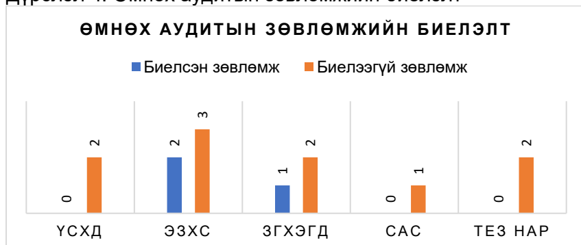
Дүрслэл 4: Өмнөх аудитын зөвлөмжийн биелэлт

Өмнөх аудитаар өгсөн зөвлөмжийн биелэлт 23 хувьтай байна.