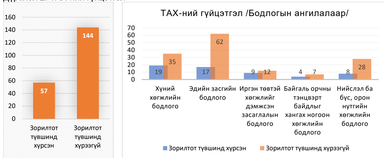
Дүрслэл 2. ТАХ-ний гүйцэтгэл

2.5. Улсын хөгжлийн 2023 оны жилийн төлөвлөгөөнд туссан ТАХ-ний гүйцэтгэл дараах байдалтай байна.