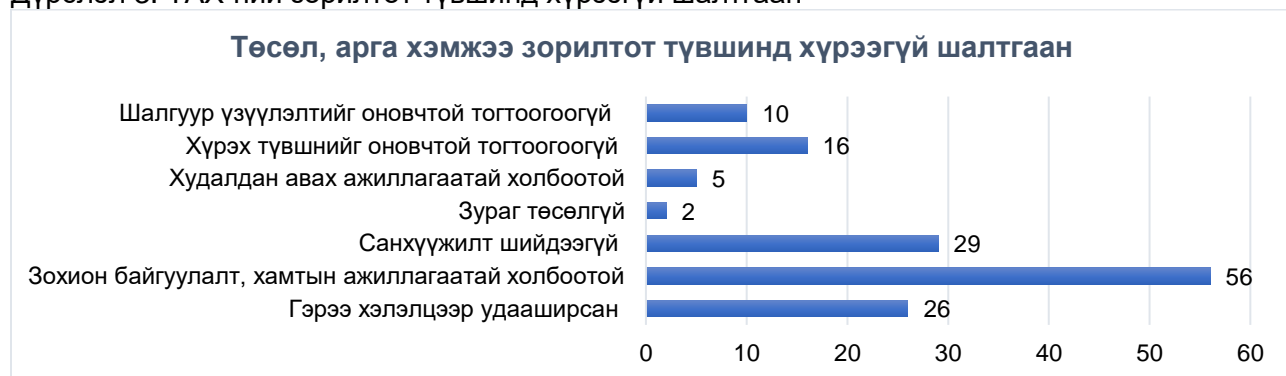
Дүрслэл 3. ТАХ-ний зорилтот түвшинд хүрээгүй шалтгаан

2.6. Дээрх үзүүлэлтээс харахад нийт ТАХ-ний 71.6 хувь нь зорилтот түвшинд хүрээгүй байна. Зорилтот түвшинд хүрээгүй шалтгааныг ангилан харуулбал: