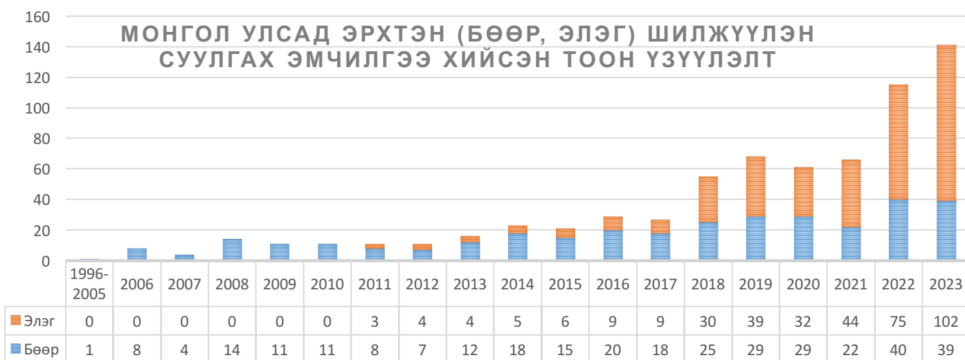
Хүснэгт 2. Монгол улсын хэмжээнд эрхтэн шилжүүлэн суулгах эмчилгээ хийсэн тоон үзүүлэлт

Манай улсын хэмжээнд бөөр болон элэг, нүдний эвэрлэг, зүрх, нойр булчирхай шилжүүлэн суулгах эмчилгээ шаардлага олон зуун иргэн байгаа бөгөөд одоогоор бөөр шилжүүлэн суулгах эмчилгээний хүлээх жагсаалтад 350, элэг шилжүүлэн суулгах хүлээх жагсаалтад 250 гаруй иргэн бүртгэлтэй байгаа болно. Энэ тоо нэмэгдэх хандлагатай байна.