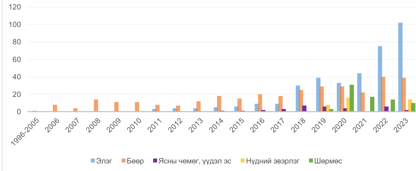
Хүснэгт 3. Монгол улсын хэмжээнд эс, эд, эрхтэн шилжүүлэн суулгах эмчилгээ хийсэн тоон үзүүлэлт