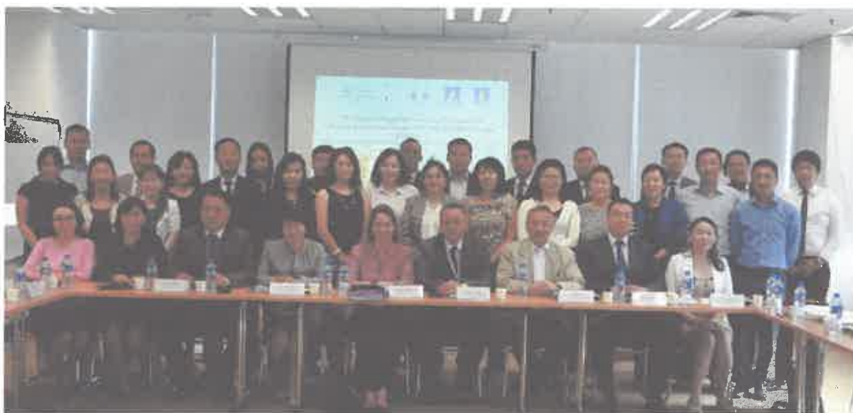
Зураг 2. "Хулгайлагдсан, эсхүл хууль бусаар экспортлогдсон соёлын эд зүйлсийн тухай" 1995 оны ЮНИДРУА-гийн Конвенцид Монгол Улс нэгдэн орох боломжийг судлах дуагүй ширээний уулзалт

Хууль зүйн үндэсний хүрээлэн, Соёлын өвийн төв болон музейн төлөөлөлүүд оролцож, Монгол улс дахь соёлын өвийн эсрэг гэмт хэрэг, тулгамдаж буй асуудал, тэдгээрийг шийдвэрлэх арга зам, ЮНИДРУА-гийн Конвенцын талаар болон конвенцид нэгдэн орсон хууль эрх зүйн үр дагавар, ач холбогдол зэргийг хэлэлцсэн 61 юм. /Зураг 2/ Хэлэлцүүлгийн үеэр ЮНИДРУА-гийн хуулийн ахлах мэргэжилтэн Марина Шнейдер 1995 оны Конвенцын тухай илтгэлдээ: Эх бичвэрийг боловсруулахад маш тодорхой, нэгдмэл хэм хэмжээ бий болгох зарчим баримталж улс орнуудын эрх бүхий байгууллагууд ижил, нэгдсэн байр сууринаас тайлбарлах нөхцлийг бүрдүүлээд тайлбар хийхийг зөвшөөрөөгүй (18) бөгөөд дотоодын хууль тогтоомжид оруулсан тусгай заалтуудаар хэрэглэх нөхцөл бүрддэг бусад гэрээ конвенцыг бодвол ямар ч тохиолдолд эрх зүйн үндэслэл болж чадах заалтуудтай болохоор шууд хэрэглэх боломжтой. Хэдийгээр Үндсэн хуульд "Монгол улсын олон улсын гэрээ нь соёрхон баталсан буюу нэгдэн орсон тухай хууль хүчин төгөлдөр болмогц дотоодын хууль тогтоомжийн нэгэн адил үйлчилнэ" гэж заасан ч 1970 оны Конвенцын заалтуудыг нарийвчлан боловсруулаагүй учир дотоодын хууль тогтоомж шиг дангаараа үйлчлэх боломжгүй 62 талаар онцлон тэмдэглэсэн байдаг.